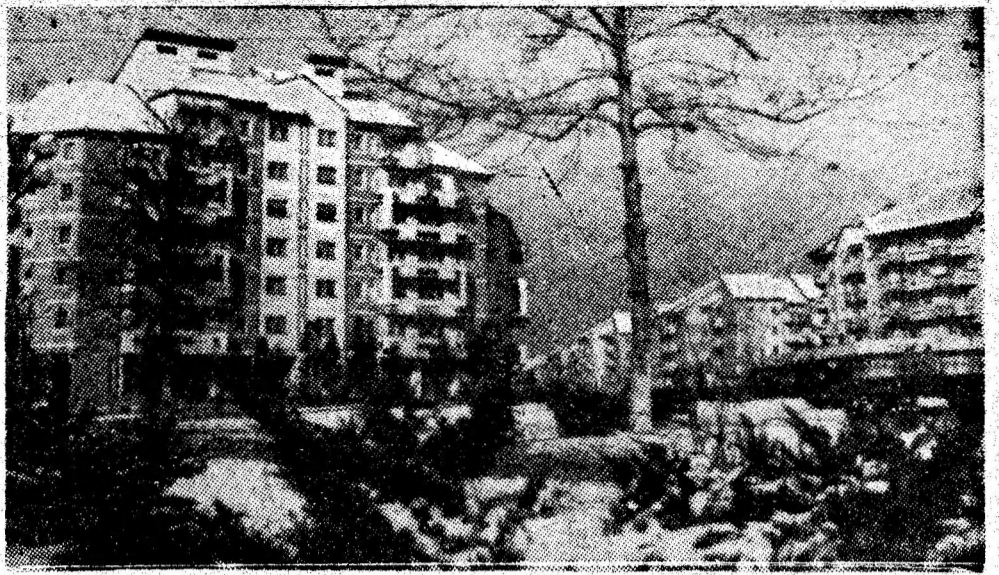
Secvență de iarnă din orașul reședință de municipiu.