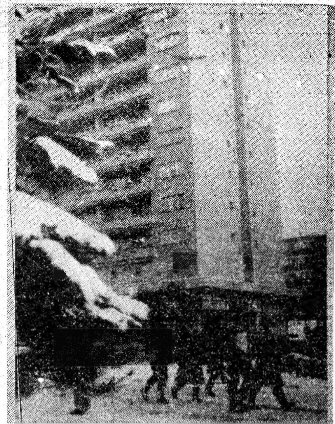
Decembrie în Petroșani.