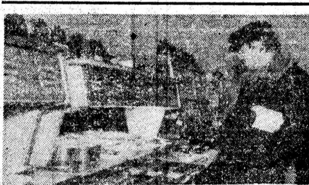
Aspect de la linia cu autoservire a restaurantului „Minerul” din Petroșani.