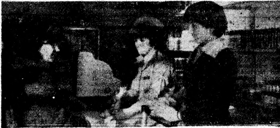
Bine aprovizionată, unitatea „Cosmetice” a ICS Mixtă Vulcan poate fi luată și ca un reper al unei serviri civilizate, în consens cu cerințele cumpărătorilor.

Ioan CIMPONER, Bulevardul Păcii, bloc 4/110, Lupeni