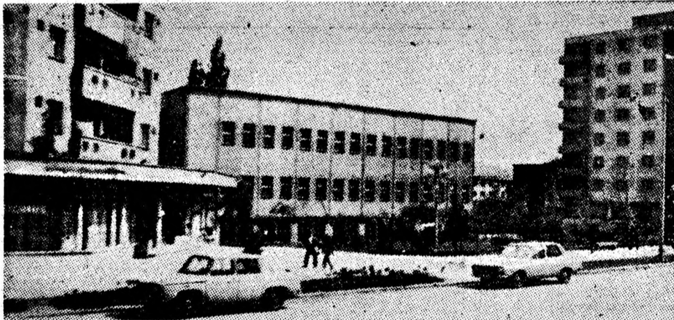
Vulcan — un oraș modern, în plină dezvoltare.

Analiza deosebit de exigentă, pe bază de bilanț, ca și dezbaterile care au avut loc au reliefat importante resurse de îmbunătățire în continuare a activității. În acest sens, au fost trasate sarcini pentru înlăturarea unor neajunsuri și intensificarea preocupărilor de ansamblu, astfel încât în anul 1989 să se înregistreze un nou salt calitativ în activitatea statelor majore, a consiliilor locale de apărare, a tuturor formațiunilor gărzilor patriotice și de luptători pentru apărarea patriei. Pornind de la sarcinile sporite ce revin organelor și organizațiilor de partid, unităților economice, întregului municipiu în anul 1989 s-a cerut să se asigure îndeplinirea neabătută a obiectivelor din programele de pregătire politico-ideologică și de luptă, să se acționeze mult mai ferm pentru ridicarea conștiinței socialiste, formarea de luptători dirzi, neînfricați, profund devotați patriei și partidului, animați de hotărârea de acțiune fără preget pentru apărarea cuceririlor revoluționare ale poporului, pentru progresul neîntrerupt al întregii societăți.