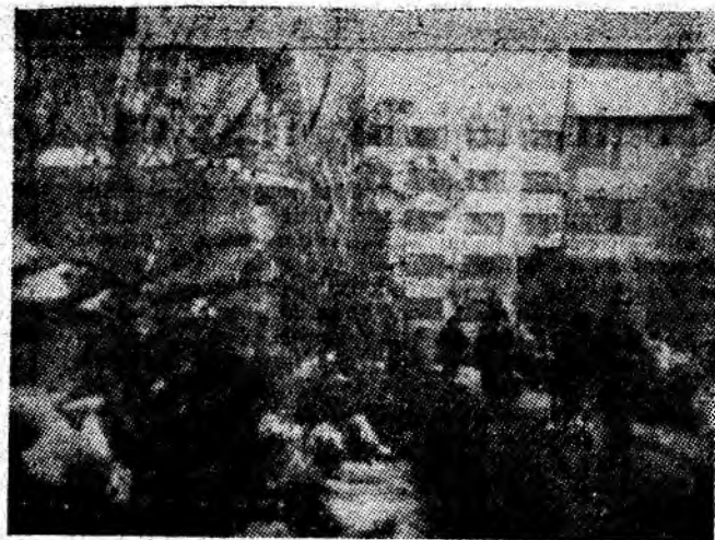
Petrosani — secvență de iarnă.