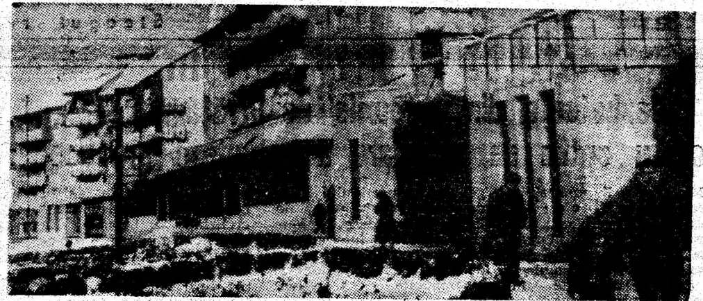
Secvență din cartierul Petroșani Nord.

ANUL XLV, NR. 11304 VINERI, 20 IANUARIE 1989 4 PAGINI — 50 BANI