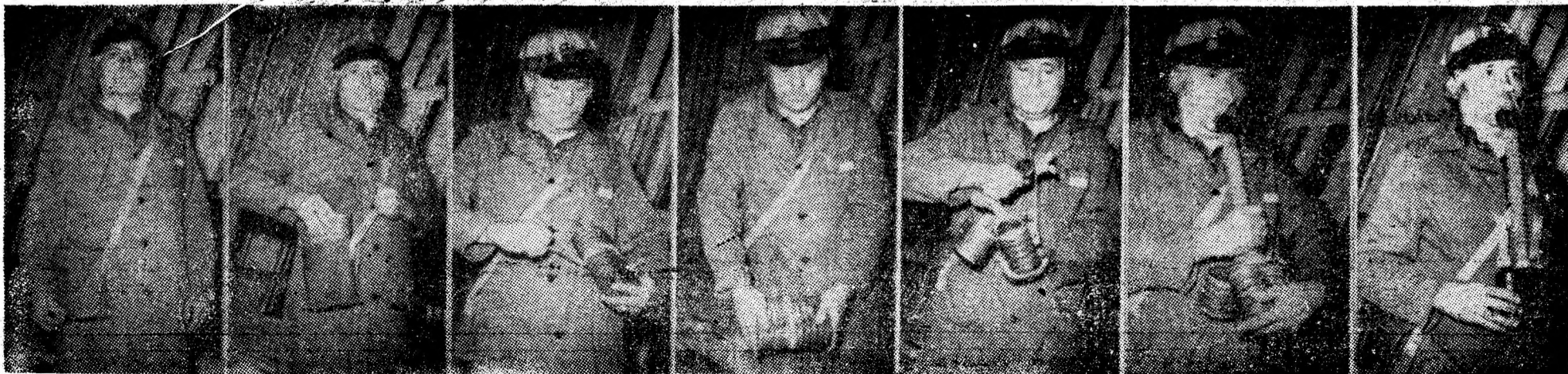
Folosirea măști de autosalvare.