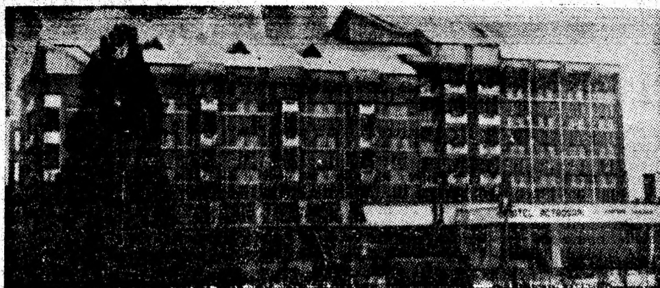
Complexul Hotelier Petroșani — o gazdă primitoare pentru cei care vizitează reședința de municipiu.

ANUL XLV, NR. 11 322 | VINERI, 10 FEBRUARIE 1989 | 4 PAGINI — 50 BANI