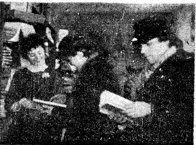
Aspect de la unul din standurile librăriei „Ion Creangă” din Petroșani.

șani, cu ocazia unei acțiuni de perfecționare profesională organizată de Centrul județean de librării, au răsplătit cu generozitate efortul artistic al interpretelor și creatorilor literari. (H. DOBROGEANU)