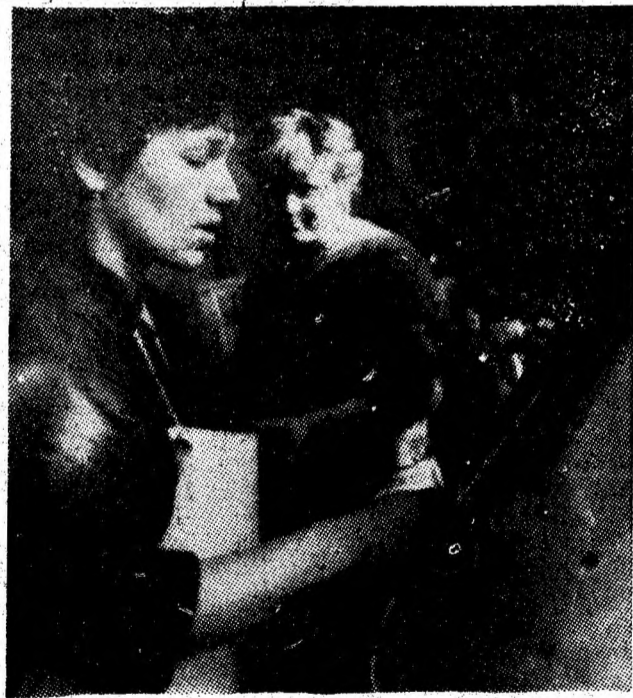
Secvență din centrul de îmbuteliere a băuturilor răcoritoare din Vulcan.

Așa cum s-a desprins și din dezbaterile recente adunări a reprezentanților oamenilor muncii din întreprinderile CMVJ, procesul de redresare a producției trebuie accelerat, prin contribuția tuturor colectivelor din minierul Văii Jiului. Numărul unităților care își îndeplinesc și depășesc sarcinile de plan poate să crească. Tendințele pe care le relevă rezultatele decadelor a doua — examinate în cadrul unui proces general de redresare — sînt semnificative în această privință, numai că se impune ca ele să capete dimensiunea stabilității, a permanenței.