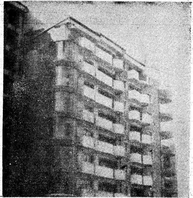
Ipostază edilitară la Lupeni.