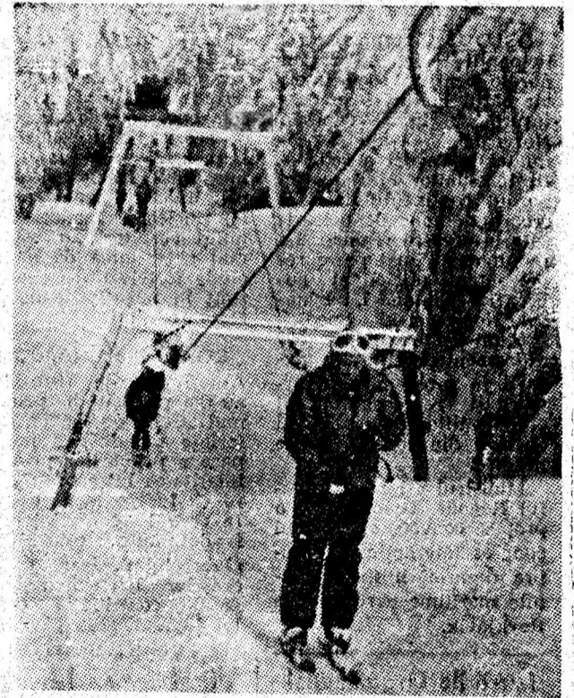
Instalația teleschiului nr. 1 din apropierea cabanei Straja, a cunoscut, duminică, 12 martie, momente de mare solicitare, cum se poate vedea din imagine.