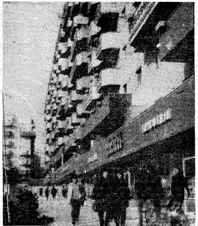
Un loc iubit de locuitorii Petrosaniului: zona Hermes.