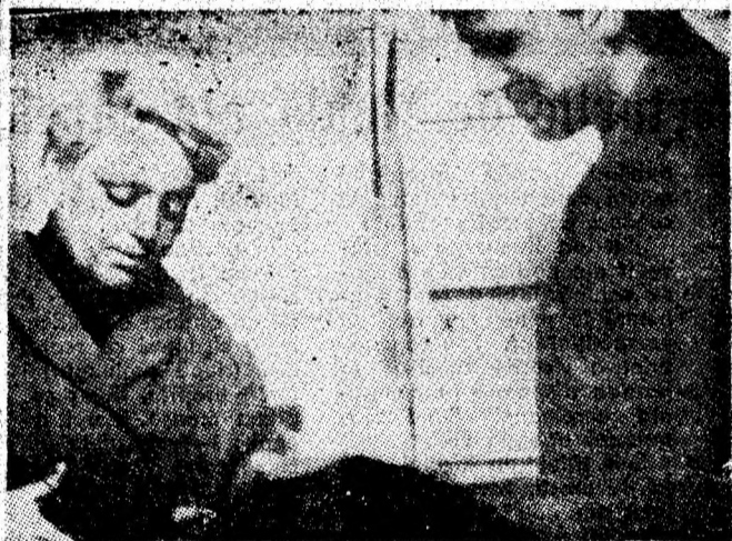
Aspect din dispensarul medical al Întreprinderii miniere Paroșeni.