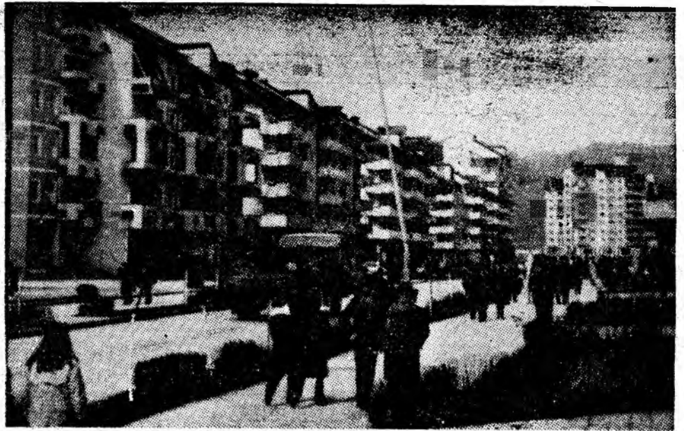
Secvență de primăvară din cartierul Petroșani Nord al reședinței de municipiu.