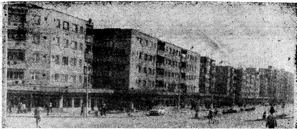
Principala arteră a orașului Vulcan — Bulevardul Victoriei.