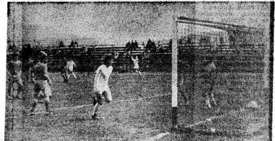
Fază din meciul Minerul Ştiinţa Vulcan — Carpaţi Agnita.

COLEGIUL DE REDACŢIE : Sabin BORGAN, Gheorghe Chirvasă, Ion DUBEK, Dorin GHETA, Ion MUSTAŢA, Simion POP — redactor şef, Teodor RUSU — redactor şef adjunct.