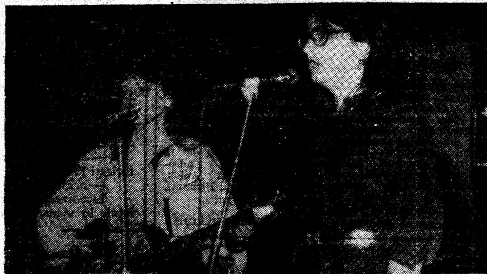
Secvență din recentul concurs de muzică ușoară susținut la Vulcan.

CONCURS. Mine, la Hunedoara, are loc etapa republicană a celei de-a VII-a ediții a Festivalului național „Cîntarea României” — concurs destinat pionierilor și uteciștilor din licee. Vor intra în întrecere și cele 36 de formații artistice ale școlărilor din municipiul Petroșani. Tuturor, le dorim succes!