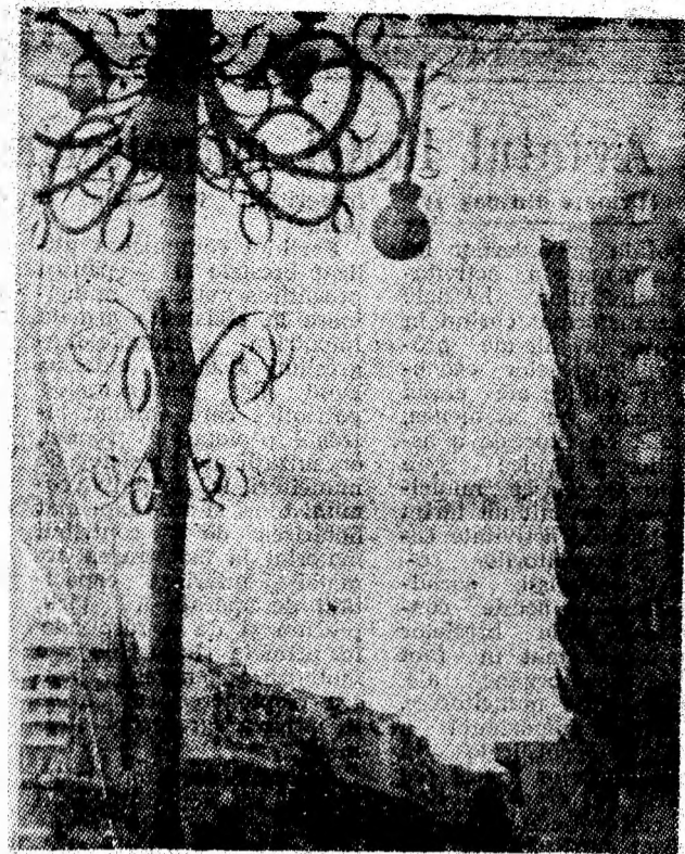
Orașul de la poalele Vilcanului își etalează, din plin, moderna zestre urbanistică.