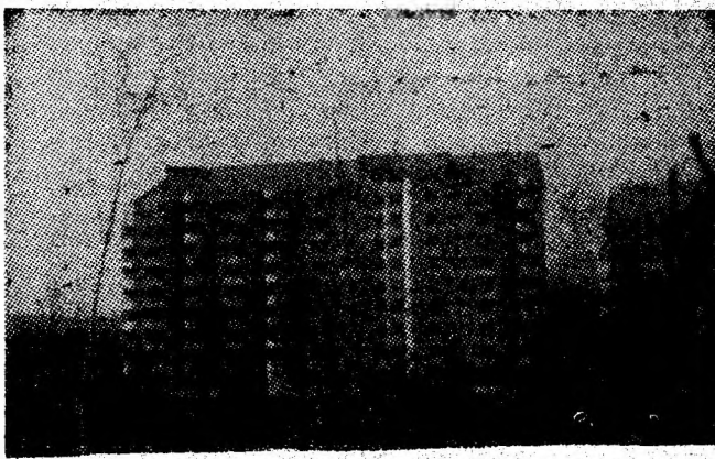
Una dintre bijuteriile arhitectonice înălțate în reședința de municipiu.

Nu ne îndoim că formațiile artistice care vor reprezenta în etapa cea mai înaltă a actualei ediții a Festivalului național „Cîntarea României” se vor pregăti pentru aceste manifestări cu toată atenția, astfel încît fiecare să contribuie la sporirea numărului de premii republicane cucerite pentru Valea Jiului. (H.D.)