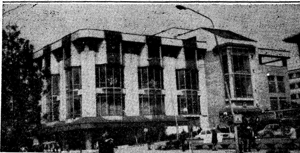
Un punct de referință al Petroșaniului: magazinul universal „Jiul”.

Nicușor REBEGA, prim-secretar al Comitetului municipal al Uniunii Tineretului Comunist