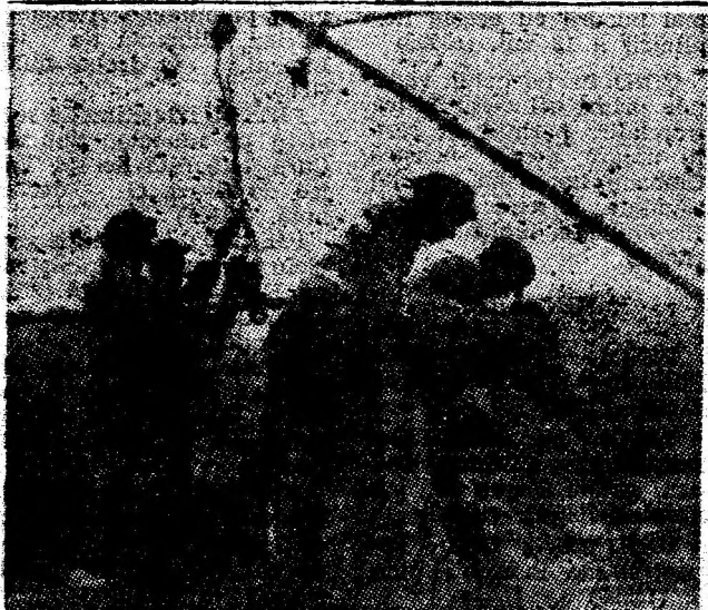
Urcați pe platforma drezinei pantograf, electricienii demontează linia de înaltă tensiune cu multă dexteritate și siguranță.

Pagină realizată de V.S. FENEȘANU