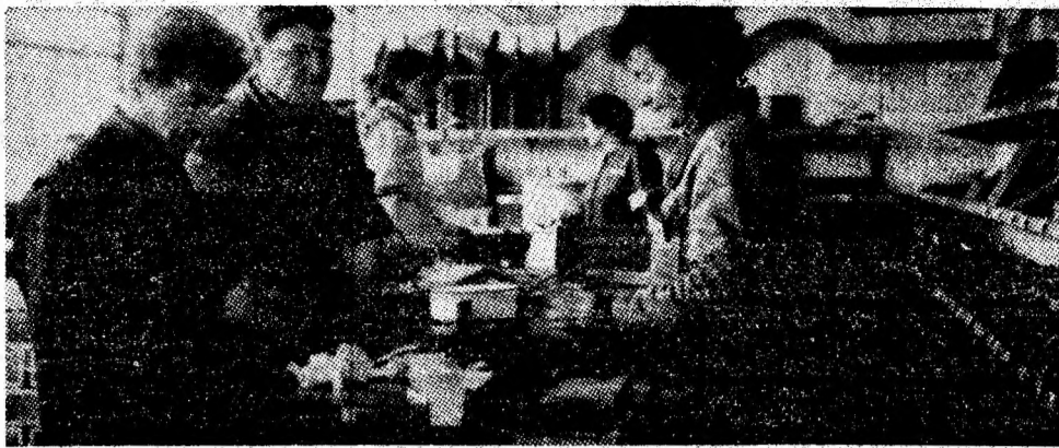
Aspect dintr-o unitate reprezentativă a ICS Mixtă Vulcan: nr. 68 „Fierăr'e”.