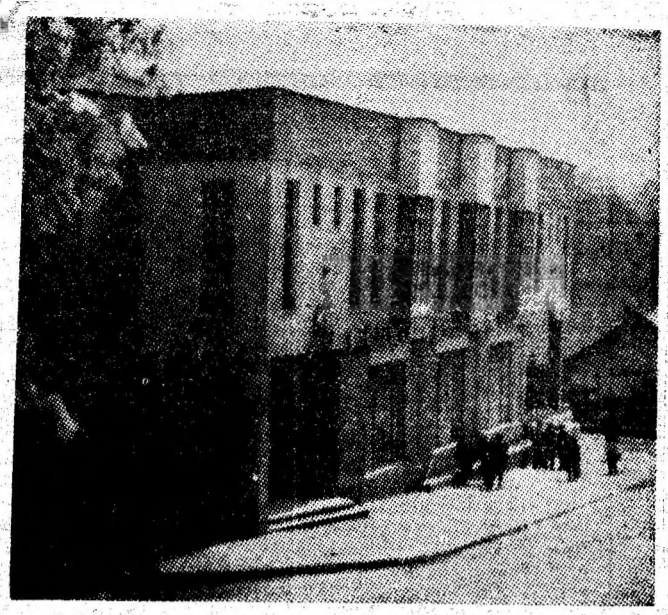
Aninoasa — profil cîtadin.

Stil de muncă dinamic, eficient, în activitatea organelor și organizațiilor de partid