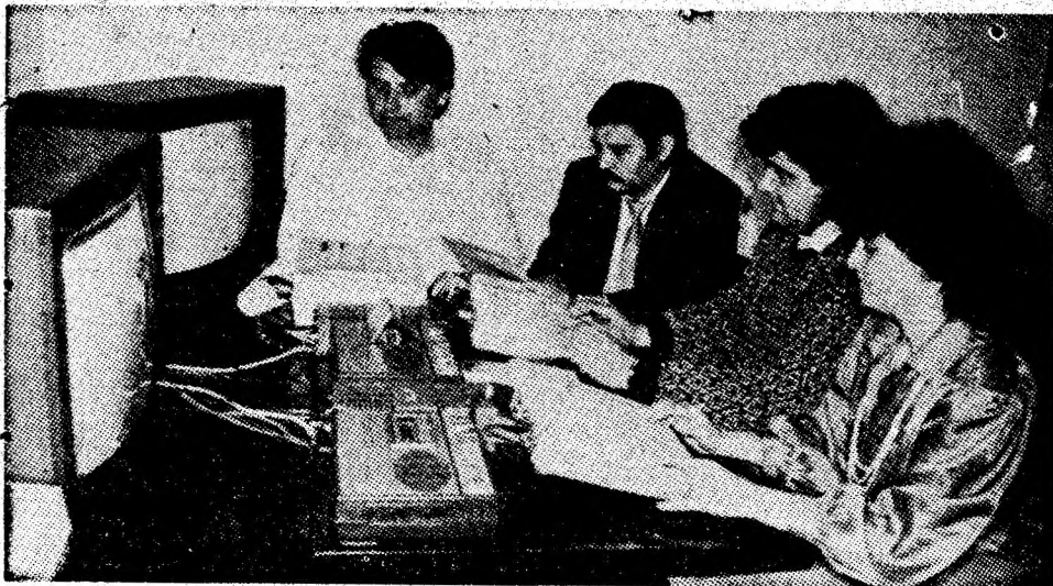
Aspect din activitatea de cercetare din cadrul ICITPMH Petroșani.