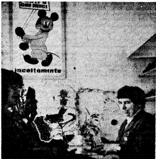
Un raion al unității de desfășurare a articolelor pentru copii, din Vulcan - cel de încălțăminte.

Sugestia locatarilor de a se amenaja un asemenea punct gospodăresc la blocurile 13, de pe strada Vasile Roaită din Petroșani o considerăm îndreptățită și o aducem în atenția sectorului de specialitate al Consiliului popular municipal în vederea soluționării. (G.C.)