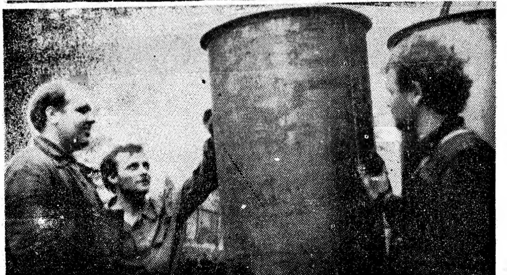
Atelierul de confecționat tuburi de aeraj al UEH Vulcan.