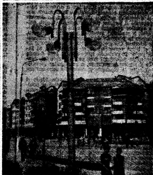
Transformări urbanistice în Petrila.

NICOLAE CEAUȘESCU, PREȘedintele REPUBLICII SOCIALISTE ROMANIA