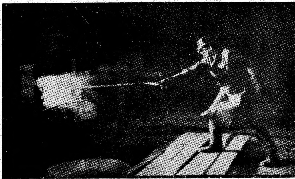
IUMP — Pregătiri în vederea elaborării unei șarje de oțel.