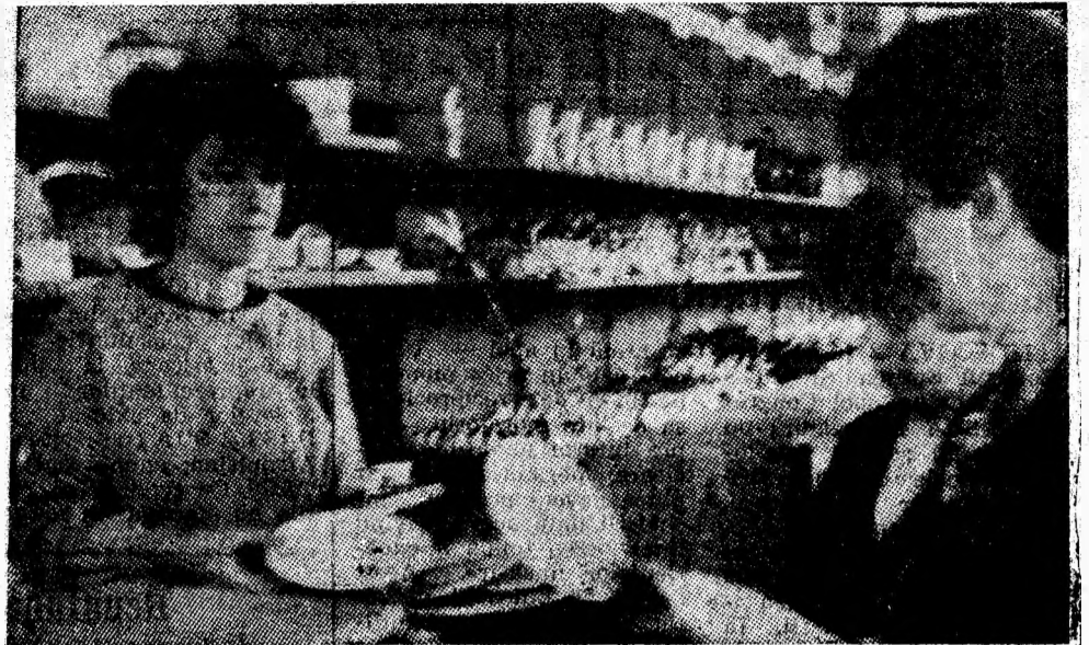
Aspect de la unul din raioanele magazinului general din Uricani.