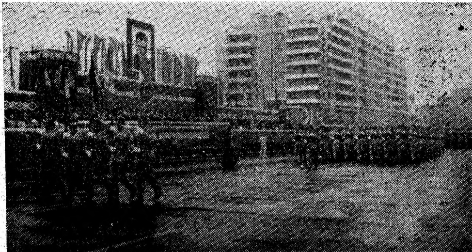
Prin fața tribunei oficiale trec detașamentele gărzilor patriotice, vajnice apărătoare ale cuceririlor revoluționare ale poporului nostru.