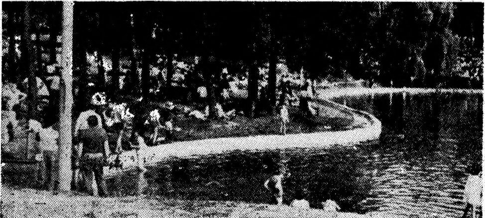
Clipe de destindere la locul de agrement „Brădet” din Petroșani.

Tradiționalul loc de agrement al locuitorilor Petrilei — Lunca Florii este unul din cele mai favorite și mai căutate zone în zile de sărbătoare. Spre acest amfiteatru natural și-au îndreptat pașii în zilele de odihnă prilejuate de aniversarea Eliberării, oamenii muncii din orașul Petrila. Au venit mineri de la Lonea, colectiv de frunte în întrecerea pentru mai mult cărbune în cinstea marii sărbători, au venit mineri ai Petrilei. Alături de minerii acestor unități au fost și cei de la minele în plină deschidere, Petri-