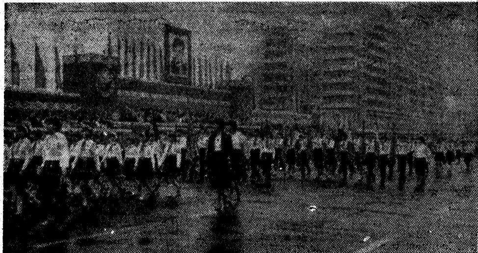
Pionierii își exprimă via recunoștință pentru minunatele condiții de învățatură create de partidul și statul nostru.