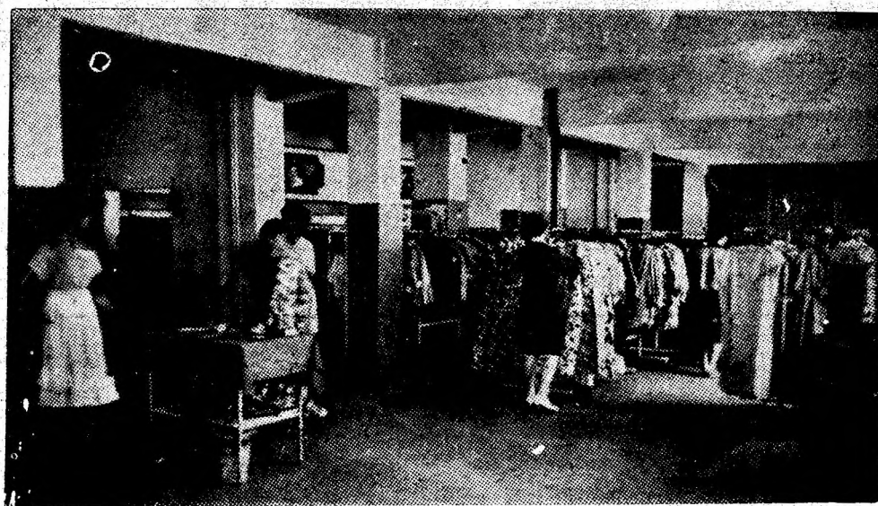
Imagine din unitatea nr. 340 confecții femei, din Lupeni.