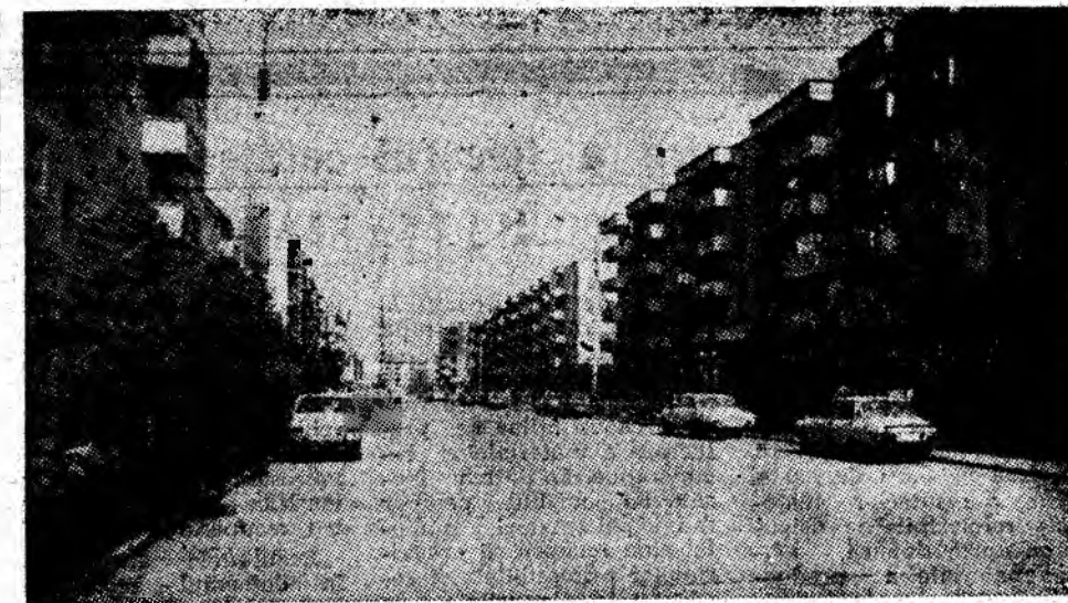
URICANI — un oraș tînăr ce se remarcă prin arhitectură modernă și spații verzi, îmbinate armonios.