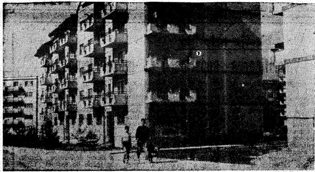
Cartierul Aeroport din Petroșani a fost extins, în ultimul timp, cu moderne blocuri de locuințe.