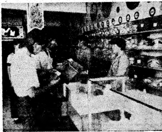
Elegantă și bună servire în magazinele ICSM Lupeni.

jele frontale 2-3, stratul 4, blocul V, sectorul III, care vor permite creșterea realizărilor cu 400-500 tone de cărbune pe zi. De asemenea, în decadele a doua și a treia, urmează a fi re-puse în funcțiune două complexe de înaltă înălțime în cărbune în sectoarele II și III. Prin lucrările de pregătire din panoul 3, stratul 5, ca și prin repararea secțiilor de complex, vom asigura creșterea productivității muncii din acest abataj și, implicit, a producției zilnice cu cel puțin 300 de tone de cărbune. În sectorul IV, depunem strădanii pentru a crea condiții mai bune de desfășurare a evacuării cărbunelui pe fluxul general de transport și de ridicare a realizărilor zilnice ale sectorului de la 800 la 1000 tone de cărbune. Măsurile luate de noi vizează, de asemenea, creșterea numărului de posturi plasate în cărbune astfel încît acestea să ajungă la nivelul planului. În general, media realizărilor zilnice din septembrie va fi superioară cu 200-300 tone de cărbune celor înregistrate în august. Ne-am propus să ridicăm nivelul realizărilor începînd încă din decada a doua, astfel încît, pînă la Congresul al XIV-lea al partidului, să putem raporta realizarea integrală a planului pe patru ani ai cincinalului.