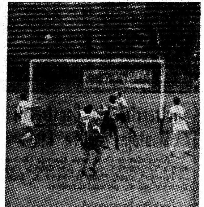
Fază de atac la poarta „dinamoviștilor”, în recenta partidă cu „Jiul”.