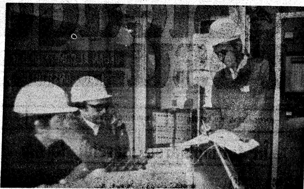
Aspect de muncă de la stația de dispecerizare și telegizmetrie a I.M. Aninoasa.