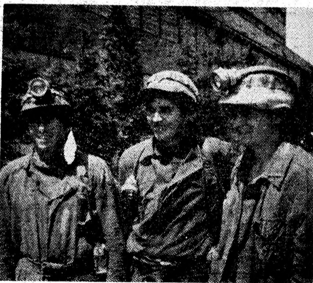
Preparația pentru cuarț Uricani