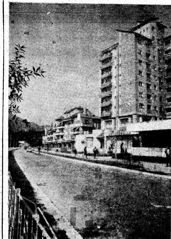
Arhitectură modernă în Petroșani.

anului, după cum ne-a informat tovarășul Gheorghe Socolescu, maistrul coordonator, colectivul a realizat o producție marfă în valoare de 1000 000 lei peste prevederile de plan. Deosebit de semnificativ este și faptul că, în aceeași perioadă, s-a realizat o producție fizică suplimentară de 300 tone preparate speciale din cuarț. La obținerea acestor rezultate au contribuit, prin munca lor rodnică,