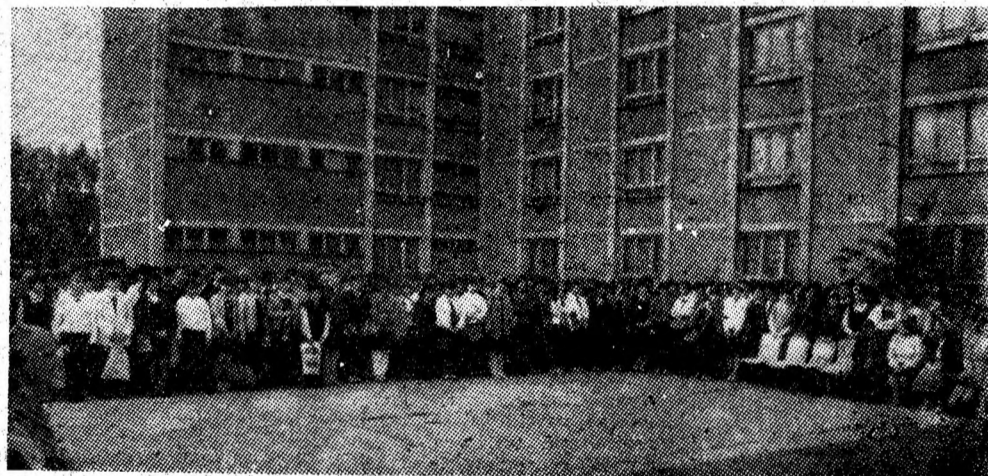
Aspect de la deschiderea anului școlar la Liceul economic și de drept administrativ din Petroșani.