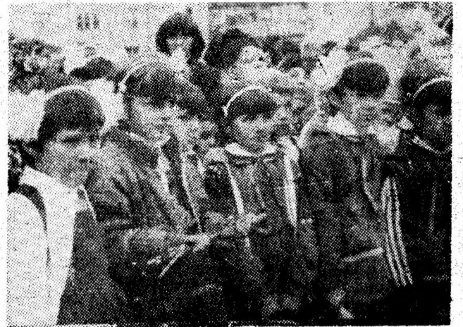
Așteptînd, cu nerăbdare, prima oră de curs.