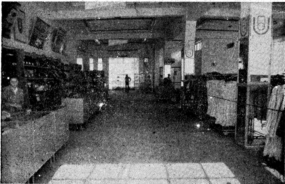
Imagine din magazinul general Uricani.

fecționare a utilajelor de bază, aflată în plină desfășurare. Mașinilor de tricotate li se adaptează un dispozitiv special, care asigură o mai mare competitivitate produselor, puțîndu-se executate, în acest fel, mai multe desene, obținîndu-se o calitate sporită a tricotelor. Pînă în prezent, au fost montate, cu forțe proprii, cinci asemenea dispozitive, urmînd ca, în acest an, acțiunea să se încheie.