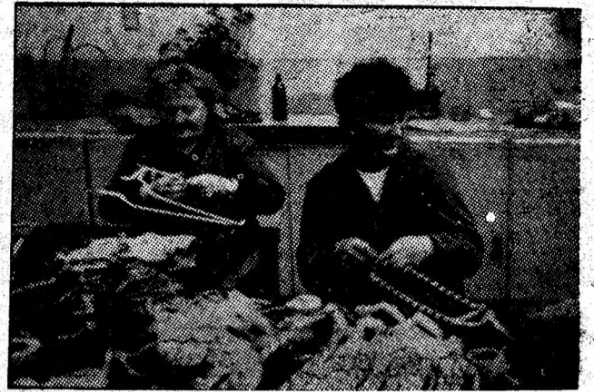
In secția de reparații motoare electrice a IPRUEEMP.

Dind expresie voinței unanime a comuniștilor, a tuturor celorlalți oameni ai muncii din sector, participanții la dezbateri și-au exprimat deplina adevărate Hotărârea CC al PCR privind re alegerea tovarășului Nicolae Ceaușescu, la Congresul al XIV-lea, în suprema funcție de secretar general al partidului — garanția fermă a înaintării țării noastre pe noi trepte de progres, a înfăptuirii pe mai departe a grandiosului program de dezvoltare multilaterală și înflorire a României socialiste.