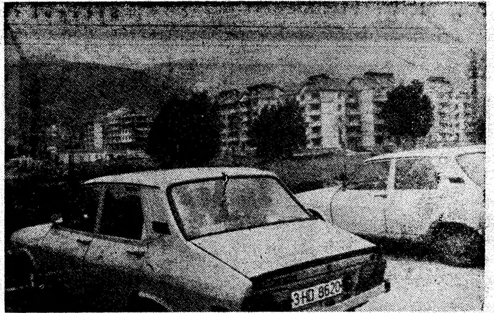
Imagine grăitoare care redă transformările petrecute pe strada Minei din Petrila.

Deschiderea abatajului menționat a însemnat, totodată, introducerea unei noi metode de lucru. Dacă în vechiul abataj cameră se realizau productivități de pînă la 4 tone de căr-