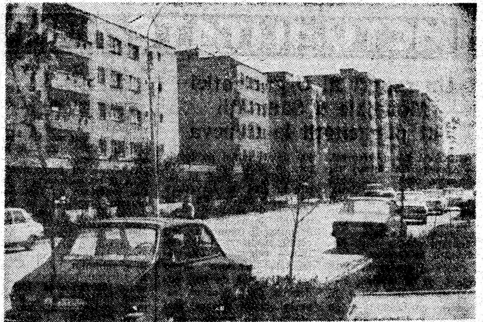
Orașele municipiului Petroșani au cunoscut în anii socialismului profunde prefaceri și înnoiri în folosul celor care asigură economiei naționale cantități sporite de cărbune. În imagine, moderne blocuri de locuințe în mereu mai frumosul oraș al minerilor — Lupeni.