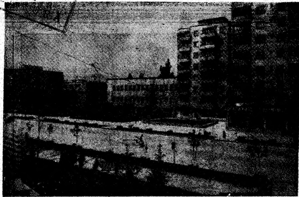
Vulcan - B-dul Victoriei împrejmuit de construcții moderne.