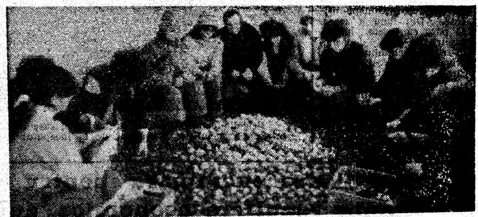
La cantina Petrila, precum și la alte cantine ale IACCJV, o atenție deosebită se acordă bunei aprovizionări cu produse agroalimentare pentru sezonul de iarnă.