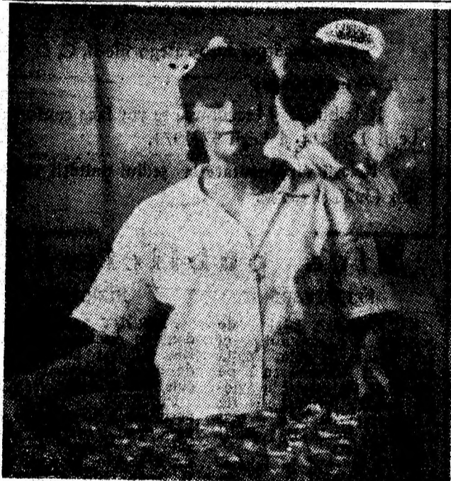
In laboratorul de producere a covrigilor, aparținând secției 3 Livezeni a I.M.P. Petroșani se realizează, zilnic, în jur de 10 000 bucăți de asemenea sortiment.

De curind, la Deva, s-a desfășurat faza județeană a concursului dotat cu „Cupa Comerțului”, manifestare devenită tradițională, organizată de Direcția comercială județeană, Consiliul județean al sindicatelor și Comitetul județean al UTC. La cele 10 probe au participat toate întreprinderile comerciale din județ, dovadă pregătirea pentru buna servire, cât și în probele sportive din cadrul întrecerii.