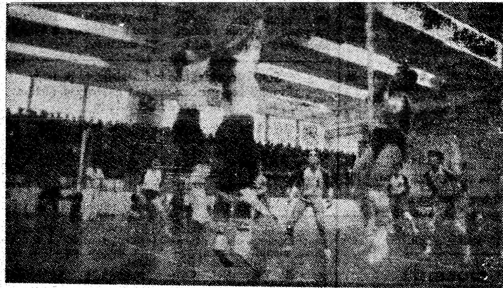
Aspect de la unul din frumoasele meciuri ale echipei de volei a IGCL Petroșani.

ETAPA VIITOARE (25 și 28-29 octombrie): FG Argeș — Victoria, Steaua — Jiul, FG Inter — SC Bacău, Petrolul — Corvinul, FG Farul — „Poli“ Timișoara, Dinamo — FCM Brașov, Flacăra — Sportul studențesc, „U“ Cluj-Napoca — Univ. Craiova, FG Olt — FG Bihor.