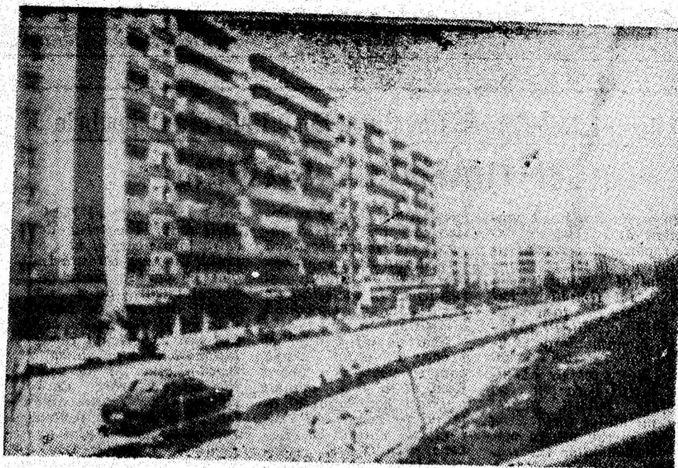
Vulcan. Siluete arhitectonice moderne mărginesc artera principală a orașului.