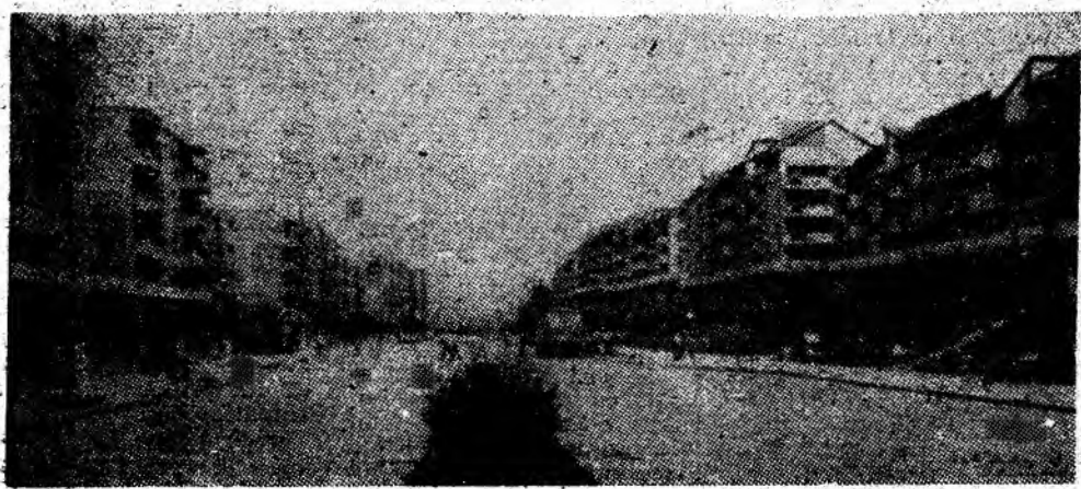
Vulcan — un oraș aflat în plină dezvoltare edilitar-urbanistică.