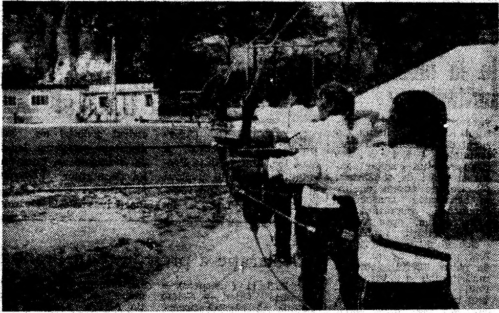
Tinerii arcași din Aninoasa — care încintă prin succesele obținute la competițiile naționale — în timpul antrenamentelor.

Antrenorul echipei Argentinei, dr. Carlos Bilardo, a declarat: grupa B este echilibrată. Formațiile URSS, României și Camerunului, fiecare cu stil diferit de joc, pot pune probleme echipei Argentinei.