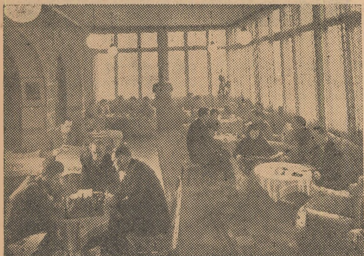
Oamenii muncii din R. P. Ungară, veniți la odihnă în Matrahaza, în halul „Sport Hotelului” din localitate.

Colectivele de muncitori de pe șantierele de construcție sunt în întrecere pentru ca locuințele să fie date în folosință într'un timp cât mai scurt. Pe șantiere sunt folosite cele mai moderne mașini de transport și alte mecanisme. (Agerpres).