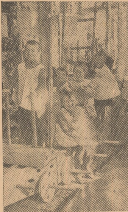
Aspect din camera de jocuri a căminului fabricii de tutun „Ducet“ din Moscova.

Așezări asemănătoare pentru feroviar se construiesc și în apropierea Moscovei. Cheltuielile sunt suportate de stat, care în anul curent a alocat în acest scop aproximativ 30 milioane ruble. (Agerpres).