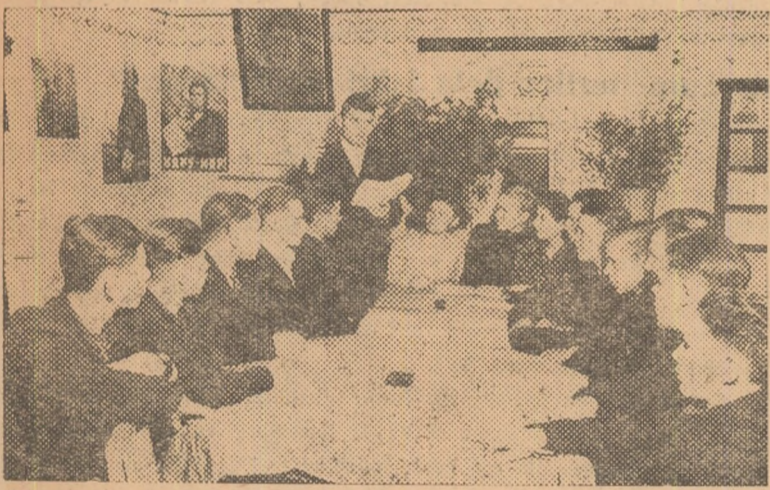
Tineretul dintr'un colhoz din Ural, ascultă cu atenție lecția ținută de lector.

La mulți ani, scumpi prieteni români! Eu și tovarășele mele, toți colhoznicii noștri, vă urăm ca în noul an să obțineți noi succese în construirea socialismului. Vom întâri și mai mult prietenia noastră de nezdruccinat!