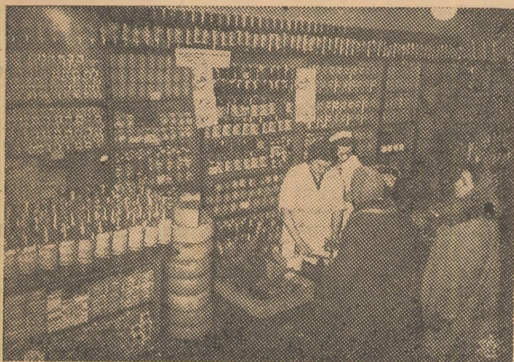
Aspect din interiorul unei cooperative de consum din Varșovia.

În curând, în voevodatul Stalinogrud se va deschide un sanatoriu de noapte pentru metalurgiști. După terminarea lucrului, metalurgiștii vor putea să primească aici asistență medicală din partea medicilor specialiști și să fie supuși unor tratamente curative și profilactice. (Agerpres).