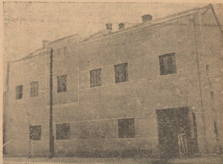
Noua fabrică de pâine din Alba-Iulia, înzestrată cu utilaj modern.

membru în gospodăria agricolă colectivă „23 August” din Obreja