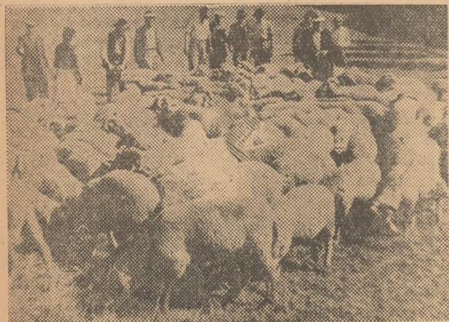
Zootehnicianul dela raion explicând agenților veterinari — la cursul zoo-veterinar — regulile de îngrijire a berbecilor de rasa „țigăie”.