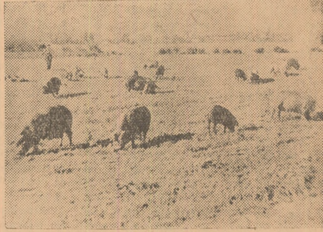
Scroafe și tineret de rasa „Bazna” din ferma gospodăriei colective „23 August” din Obreja.