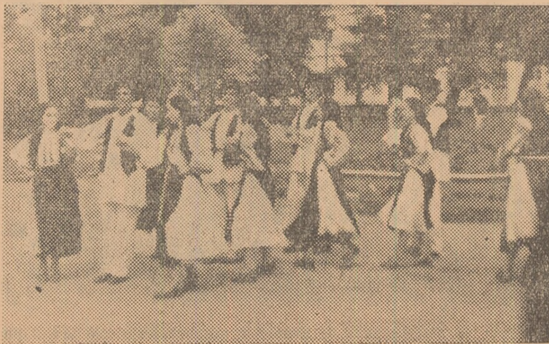
Echipa de jocuri populare din comuna Pețelca executînd „Haidăul”