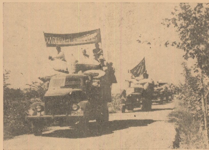
In foto: Primul convoi cu bumbac din recolta nouă din colhozul „Malencov”, raionul Kurgan R. S. S. Tadjică.

Țăranii din Azerbaidjan au obținut anul acesta o recoltă de bumbac care depășește recoltele ultimilor cîțiva ani. Pe numeroase plantații s-au și recoltat peste 30 chintale de bumbac la hectar. De asemenea, s-a obținut o recoltă bogată de alte culturi agricole.