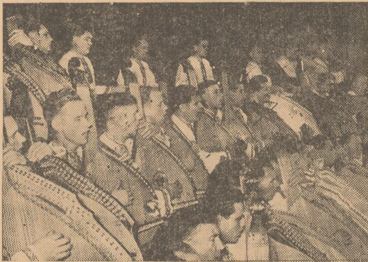
In foto: Primul concert al Capellei emerite de stat, de banduriști din R. S. S. Ucraineană, în sala Teatrului C.F.R. Giulești.

mecanic de locomotivă la Depoul C.F.R. Teiuș