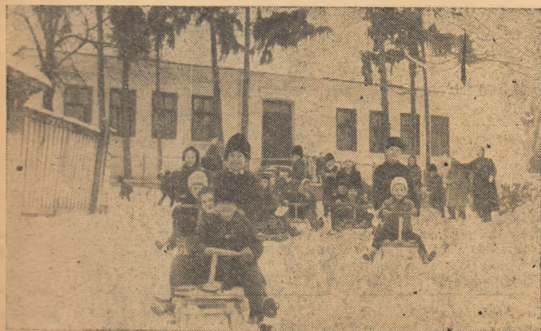
Săniatul este unul din sporturile preferate ale elevilor școlii de 4 ani din satul Cetea.

IN CLIȘEU: Un grup de elevi lasăniat pe ulița din preajma școlii.