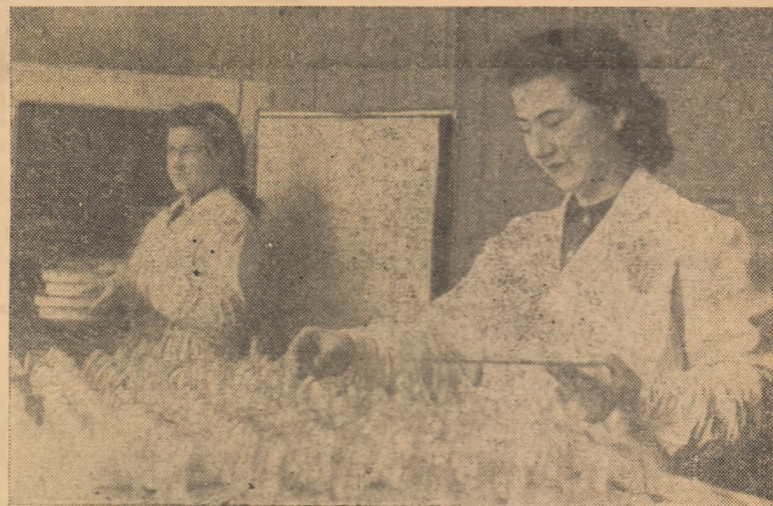
IN CLIȘEU: Executarea probelor de germinare la Laboratorul regional din Alba-Iulia, pentru controlul semințelor.