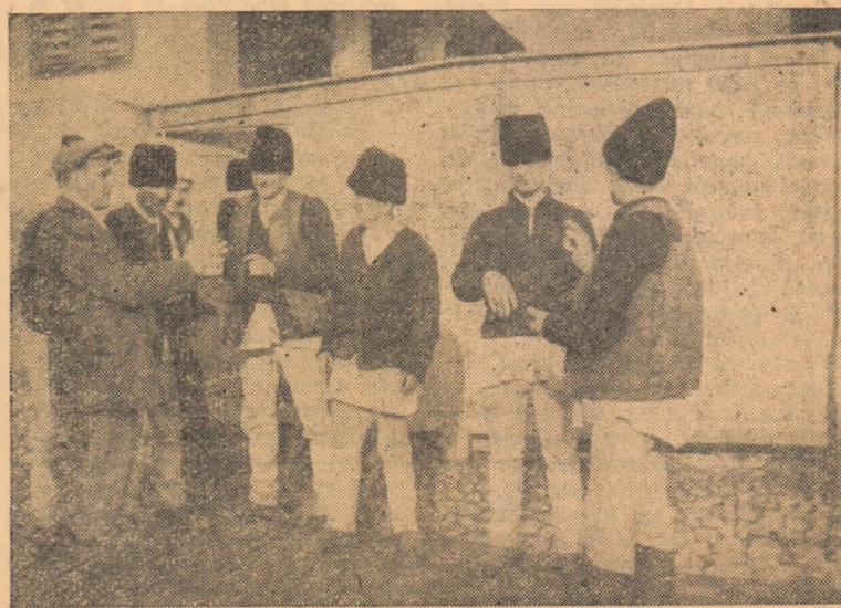
ÎN CLIȘEU: Agitatorii în mijlocul țărănilor muncitori — satul Bucerdea Vînoasă.

În Igihii și în satele ce aparțin acestei comune, numărul țărănilor muncitori ce se înscriu în gospodăria colectivă crește zi de zi.