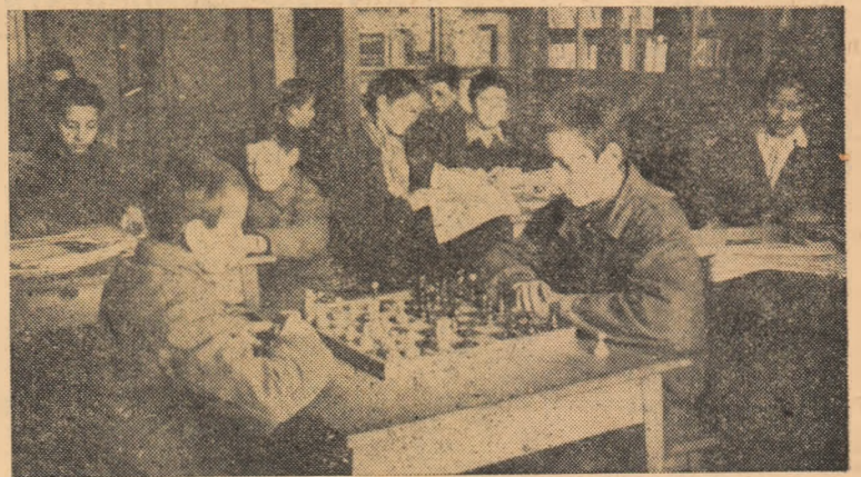
ÎN CLISEU: Elevii Școlii profesionale de mecanică agricolă în orele libere la clubul școlii.

Sprijinul de care se bucură sfatul popular comunal din partea cetățenilor este chează în îndeplinirii sarcinilor propuse.