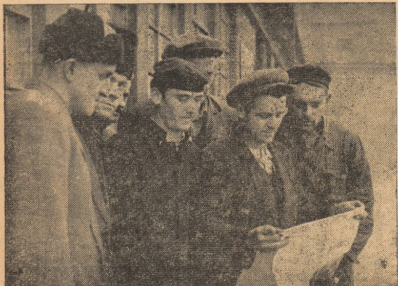
Oamenii muncii din raion urmăresc cu deosebit interes lucrările celui de-al XXI-lea Congres al P. C. U. S.