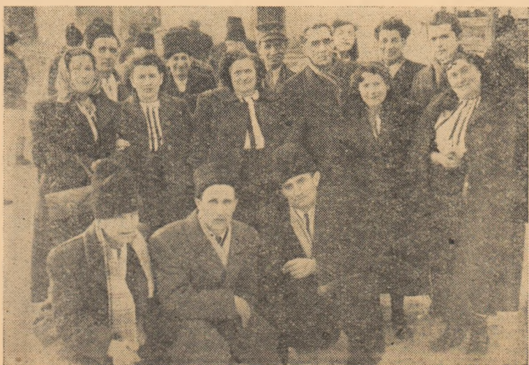
IN CLIȘEU: O parte din formația artistică a căminului cultural din Vințul de Jos.