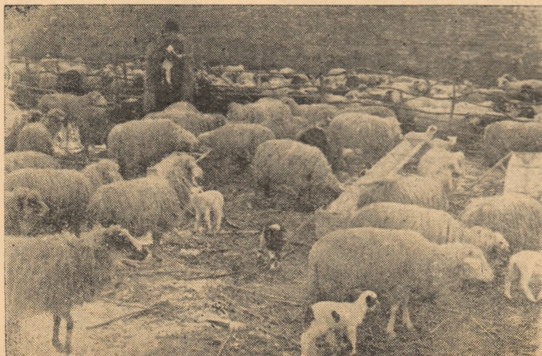
Turma de oi a gospodăriei colective „8 Martie” din satul Micești.

Lichidarea lipsurilor de mai sus, care dau întrecerii un caracter formal, trebuie să constituie o preocupare principală a organizației de bază din cadrul cooperativei. Ea trebuie să desfășoare o largă muncă politică pentru antrenarea tuturor muncitorilor la luarea unor angajamente cît mai concrete, în raport cu posibilitățile.