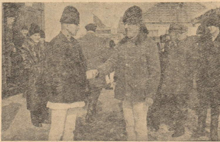
Și acum spor la muncă tovarășe președinte...